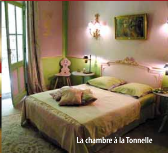
La chambre à la Tonnelle