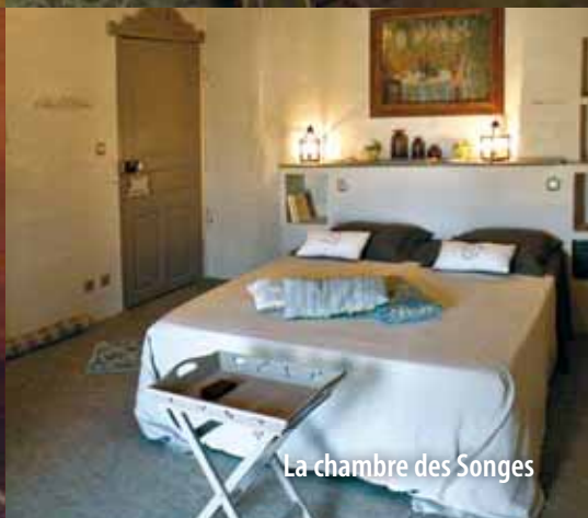
La chambre des Songes