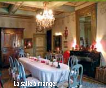
La salle à manger