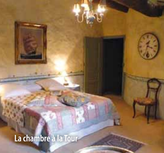
La chambre à la Tour

Nichées au coeur du Château de Pouget, les cinq chambres d'hôtes de charme vous accueillent dans un cadre historique haut de gamme.