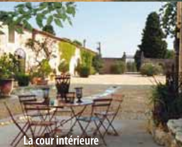
La cour intérieure