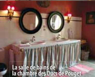
La salle de bains de la chambre des Ducs de Pouget