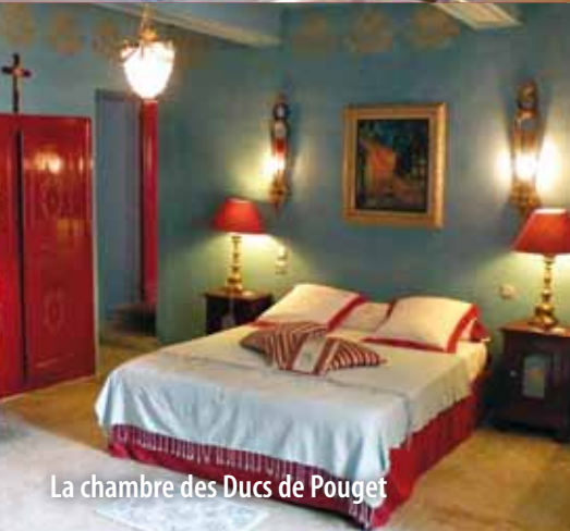
La chambre des Ducs de Pouget