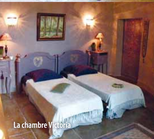
La chambre Victoria