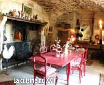
La cuisine du XXII e